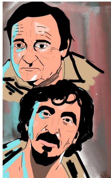
Ilustração: Murilo Donizeti

"O Poço" é um filme bem interessante. Alguns podem não tê-lo entendido totalmente e ter sentido até um certo "nojo" ou indignação frente a pensamentos como "Por que essas pessoas se candidatariam para algo assim?". Contudo, vendo pelo lado crítico, o filme diz muito. Ele pode representar os problemas sociais que vivemos, como a ignorância, a divisão de classes, a forma das pessoas de seguirem ou não as leis e as regras, inclusive o respeito, a sobrevivência e muito mais.