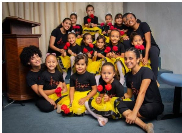
Musical "As estações da alma" (2019).

Se você gostou dessa matéria e quer conhecer um pouquinho mais do nosso grupo, é só acessar o nosso perfil no instagram @amarte_ieq .