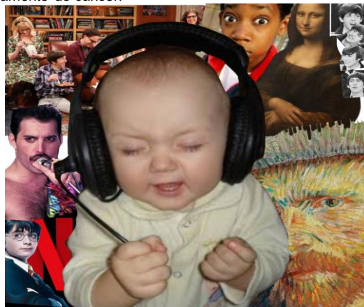
Ilustração: Murilo Donizeti

Contudo, o estudo divulgou que as atividades artísticas podem ser aliadas dos serviços de saúde, completando ou aprimorando protocolos de tratamento. Não importa se introduzidas no contexto terapêutico de forma passiva ou ativa - seja ouvindo música, desenhando e pintando -, essas atividades diminuem, por exemplo, os efeitos colaterais do tratamento do câncer.